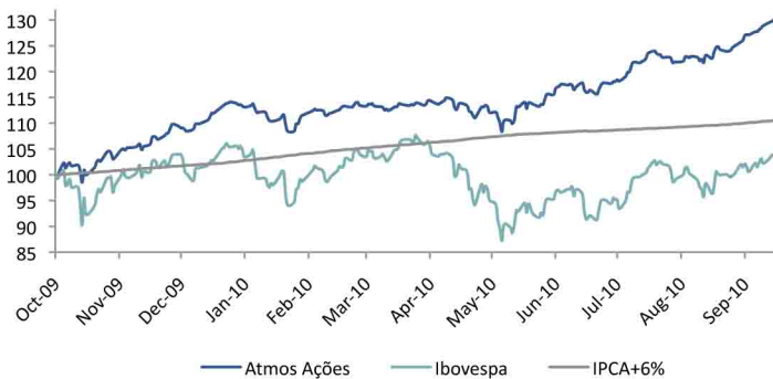
GRÁFICO DA PERFORMANCE

***Master, FIAs exclusivos e fundo espelho para investidores estrangeiros